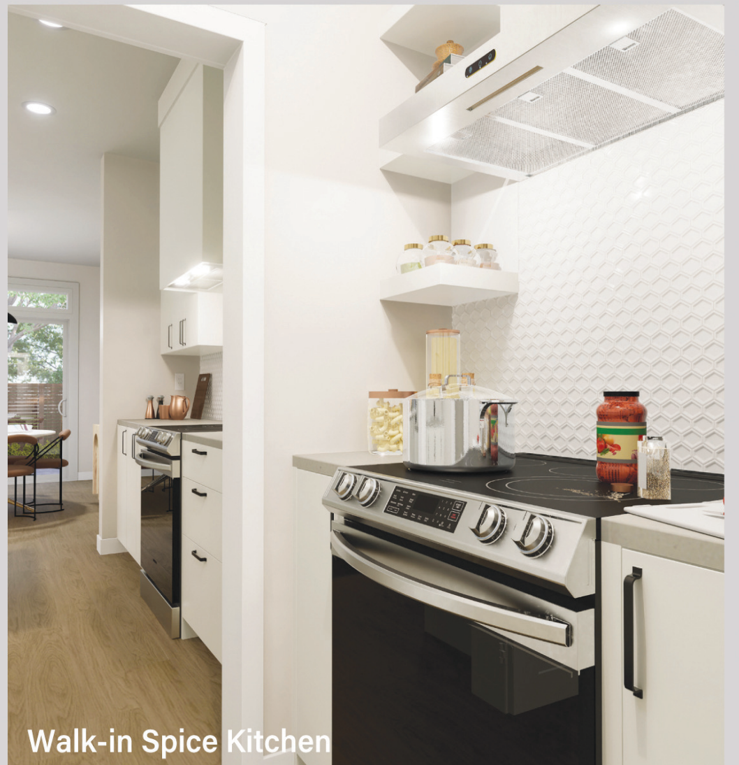
Walk-in Spice Kitchen

SHOWHOMES NOW OPEN 1233 Copperfield Blvd SE, Calgary, AB T2Z 5G1