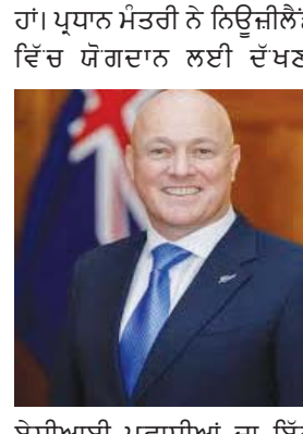
ਏਸ਼ੀਆਈ ਪ੍ਰਵਾਸੀਆਂ ਦਾ ਇੱਕ ਹੋਰੀ ਦੇ ਸਮਾਗਮ ਵਿਚ ਧੰਨਵਾਦ ਕੀਤਾ ਹੈ, ਕਿਹਾ ਕਿ '‘ਤੁਸੀਂ