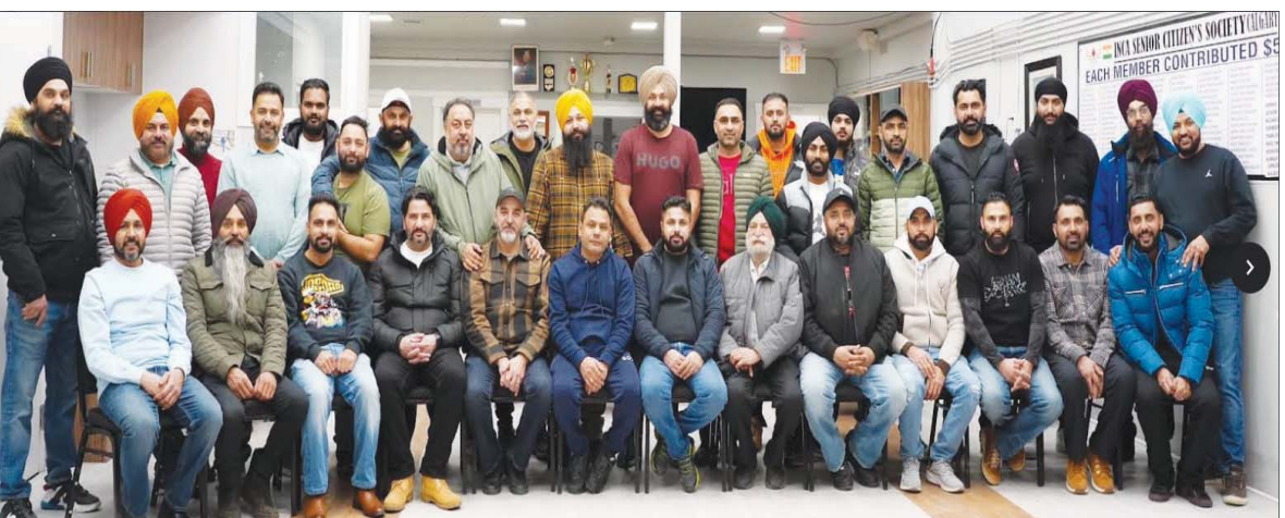
ਕੈਨੇਡਾ ਦੇ ਜੰਪਲ ਬੱਚਿਆਂ ਨੂੰ ਹਾਕੀ ਉੱਪਰ ਉਪਰਾਲੇ ਕੀਤੇ ਜਾਂਦੇ ਹਨ ਅਤੇ ਜੋੜ ਕੇ ਰੱਖਣਾ ਇਸ ਕਲੱਬ ਦੇ ਦੋ ਨਾਲ ਜੋੜਨ ਦੇ ਲਈ ਵੱਡੇ ਪੱਧਰ ਪੰਜਾਬੀ ਭਾਈਚਾਰੇ ਨੂੰ ਖੇਡਾਂ ਦੇ ਨਾਲ ਹਿੱਸੇ ਆਇਆ ਹੈ।