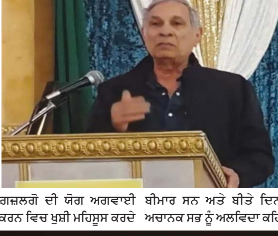
ਗ਼ਜ਼ਲਕਾਰ ਦੀ ਯੋਗ ਅਗਵਾਈ ਬੀਮਾਰ ਸਨ ਅਤੇ ਬੀਤੇ ਦਿਨ ਕਰਨ ਵਿਚ ਖੁਸ਼ੀ ਮਹਿਸੂਸ ਕਰਦੇ ਅਚਾਨਕ ਸਭ ਨੂੰ ਅਲਵਿਦਾ ਕਹਿ ਗਏ।