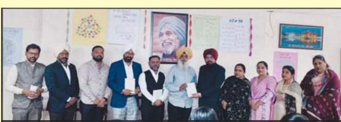
ਯੂਨੀਵਰਸਿਟੀ ਕਾਲਜ ਜੈਤੋ ਵਿਖੇ ਅੰਤਰਰਾਸ਼ਟਰੀ ਮਾਤ ਭਾਸ਼ਾ ਦਿਵਸ ਮੌਕੇ ਮਹਿਮਾਨਾਂ ਦਾ ਸਨਮਾਨ ਕਰਦੇ ਹੋਏ ਕਾਲਜ ਦੇ ਪ੍ਰਬੰਧਕੀ ਟੀਮ ਮੈਂਬਰ

ਜੈਤੋ (ਪੰਜਾਬੀ ਅਖਬਾਰ ਬਿਉਰੋ) ਪੰਜਾਬੀ ਮਾਂ ਬੋਲੀ ਅਜੋਕੇ ਦੌਰ ਵਿੱਚ ਜੁਗਗਰ ਦੀ ਭਾਸ਼ਾ ਕਿਵੇਂ ਬਣੇ ਇਹ ਸੋਚਣ ਦੀ ਪ੍ਰਮੁੱਖ ਲੋੜ ਹੈ। ਪੰਜਾਬੀ ਭਾਸ਼ਾ ਦੇ ਜ਼ਰੀਏ ਸਿਰਫ਼ ਰੋਟੀ ਦੀ ਨਹੀਂ ਬਲਕਿ ਚੌਪੜੀ ਰੋਟੀ ਵੀ ਖਾਧੀ ਜਾ ਸਕਦੀ ਹੈ। ਇੰਨ੍ਹਾਂ ਵਿੱਚਾਰਾਂ ਦਾ ਪ੍ਰਗਟਾਵਾ ਯੂਨੀਵਰਸਿਟੀ ਕਾਲਜ ਜੈਤੋ ਦੇ ਪੋਸਟ-ਗ੍ਰੈਜੂਏਟ ਪੰਜਾਬੀ ਵਿਭਾਗ ਵੱਲੋਂ ਅੰਤਰਰਾਸ਼ਟਰੀ ਮਾਤ ਭਾਸ਼ਾ ਦਿਵਸ ਸਬੰਧੀ ਕਰਵਾਏ ਸਮਾਗਮ ਵਿੱਚ ਮੁੱਖ ਮਹਿਮਾਨ ਵੱਜੋਂ ਸ਼ਾਮਲ ਹੁੰਦਿਆਂ ਕੈਨੇਡਾ